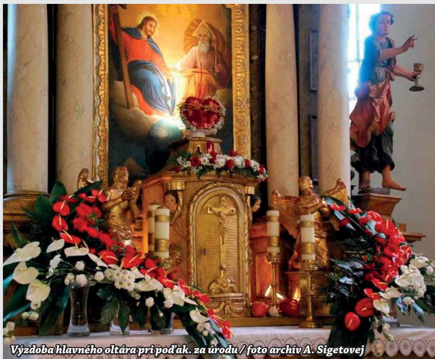
Výzdoba hlavného oltára pri poďak. za úrodu / foto archív A. Sigetovej

Táto práca si vyžaduje hlavne chcieť to robiť a mať čas. Mňa táto práca veľmi baví. V podstate ja pri tom relaxujem. Dôležité je treba si dopredu rozmyslieť, čo sa bude aranžovať, na akú príležitosť, na aký cirkevný sviatok je určené aranžovanie a potom aké kvety treba kúpiť a hlavne dopredu objednať. Cez bežný rok, keď nie je žiadny