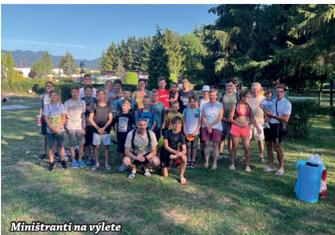
Miništranti na výlete

Tento rok sa výlet miništrantov začal v nedeľu 3. júla presunom na kúpalisko Veronika v Rajci. Po vyskúšaní šmykačiek a toboganov komplet celou osádkou výletu sme sa previezli na miesto prenocovania - kemp Varín pri Terchovej. Úlohu postavenia stanov zvládli všetci príkladne a mohol nasledovať futbalový zápas, následná opekačka a noc pod stanom. Do nového dňa sme vstúpili sv. omšou, raňajkami a mohli sme sa vydať na turistiku do Vrátnej doliny a hrebeňovkou sme si spríjemnili slnečný deň. Všetci sa úspešne a hlavne v poriadku vrátili domov, aby sa mohli o svoje zážitky podeliť vo svojich rodinách. Ďakujeme za pomoc a organizáciu, ako aj deťom za príkladnú disciplínu.