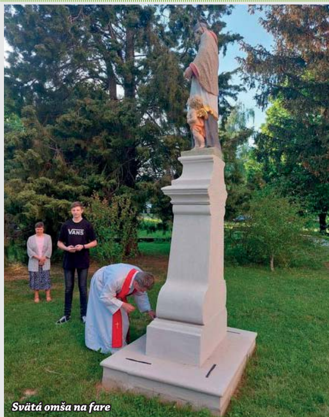
Svätá omša na fare