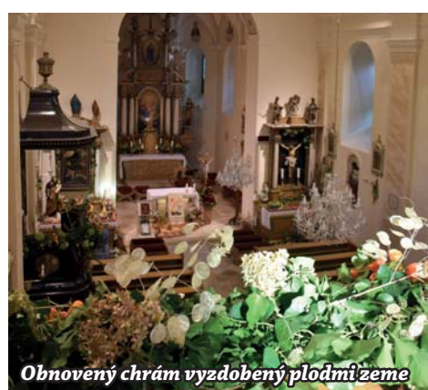
Obnovený chrám vyzdobený plodmi zeme