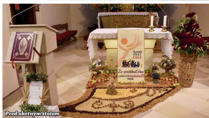
Pred obetným stolom