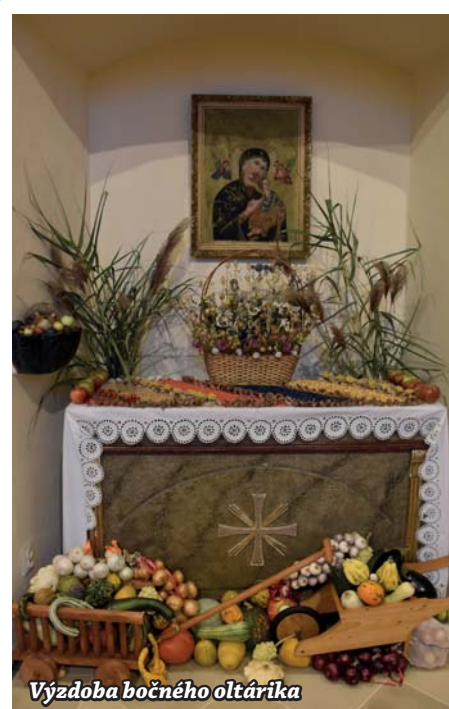
Výzdoba bočného oltára