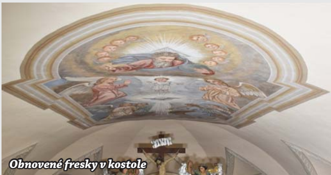
Obnovené fresky v kostole