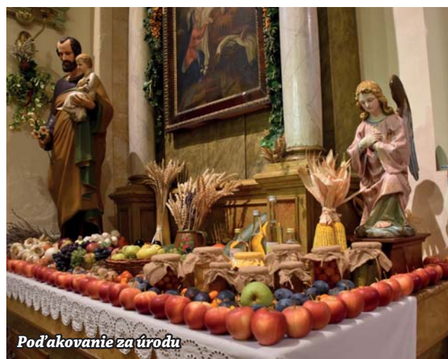
Pod'akovanie za úrodu