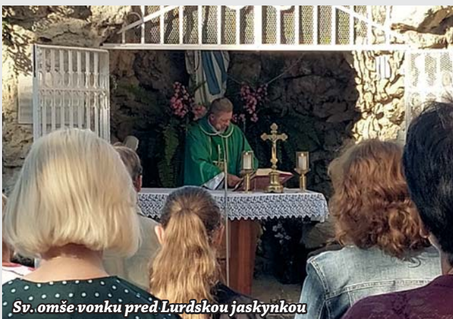
Sv. omše vonku pred Lurďskou jaskynkou