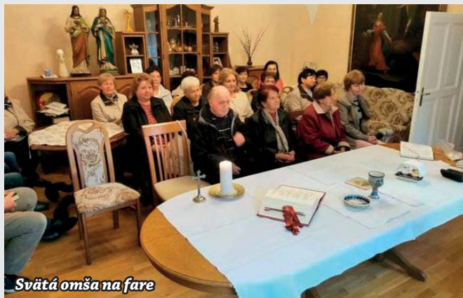
Svätá omša na fare