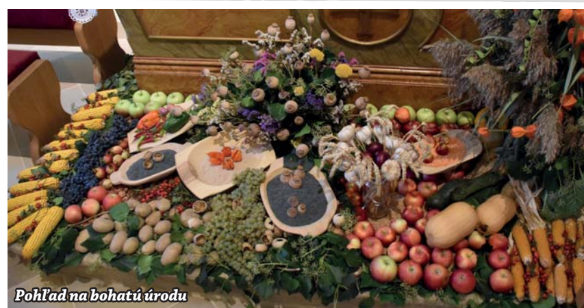
Pohľad na bohatú úrodu