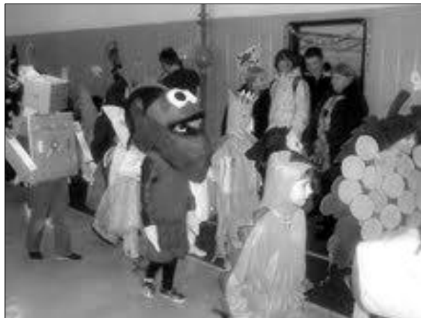
Škoda, že fotografia nemôže byť vo farbe.....