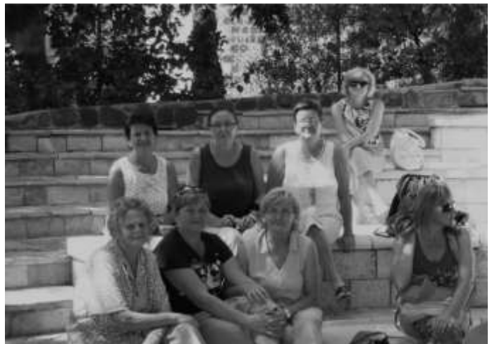
Účastníčky putovania po Sv. zemi