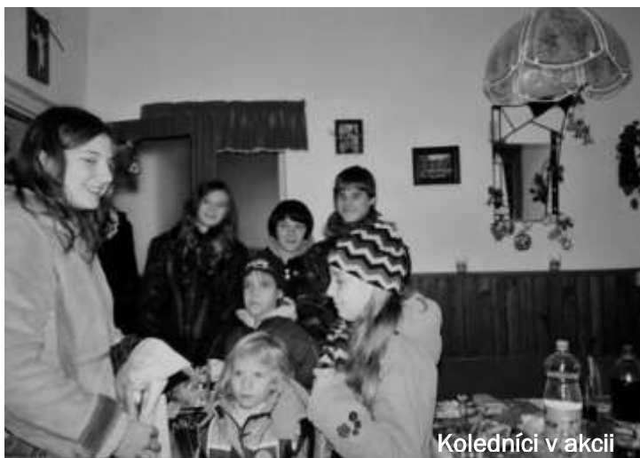
Koledníci v akcii

Ďakujeme všetkým, ktorí koledníkov prijali, finančne prispeli a deti obdarovali množstvom sladkostí. Už sa tešia, že sa spolu budú môcť z nich pohostiť na vyhodnocovacom stretnutí.