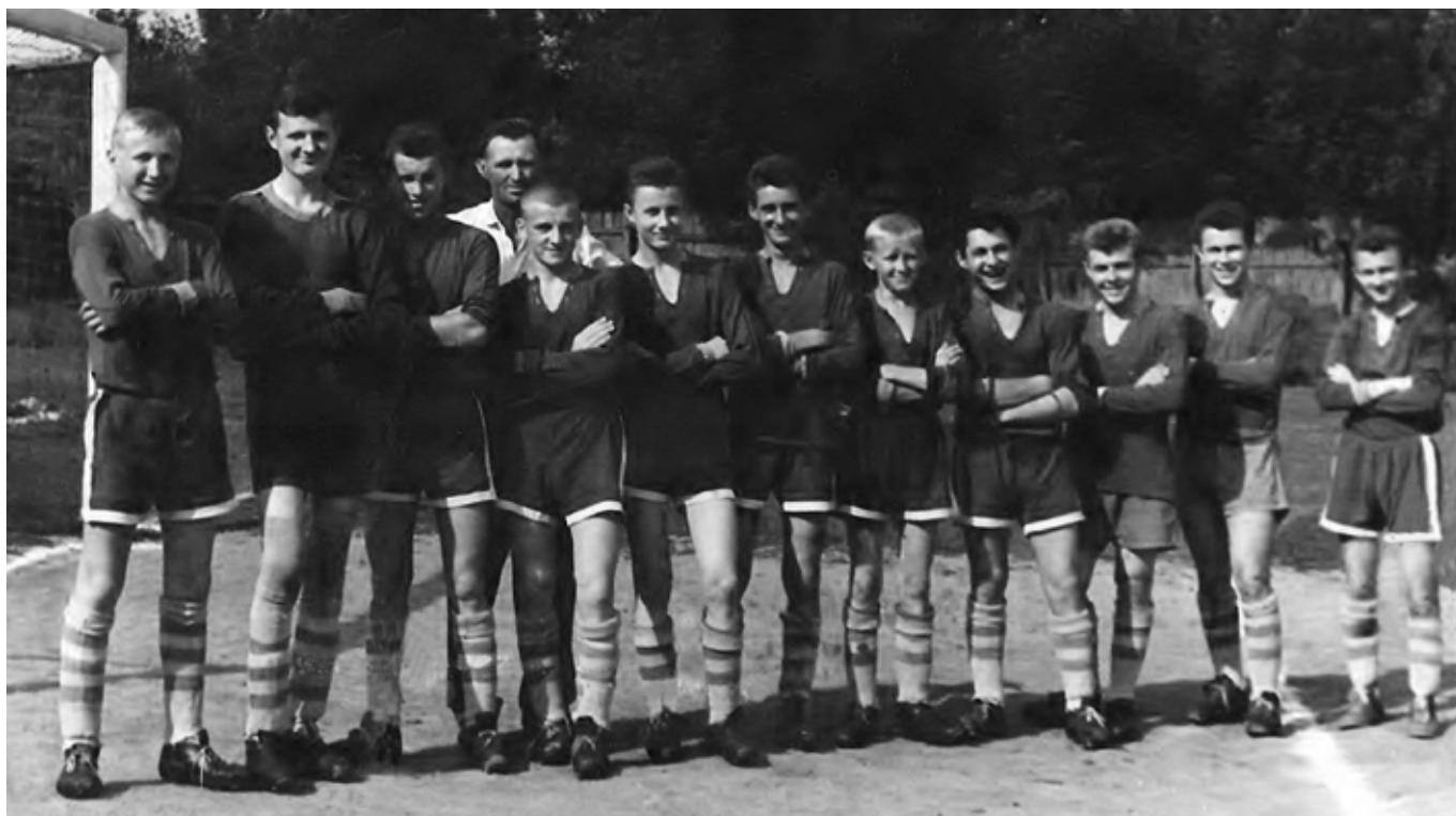
Dorastenci z futbalového ročníka 1960/1961