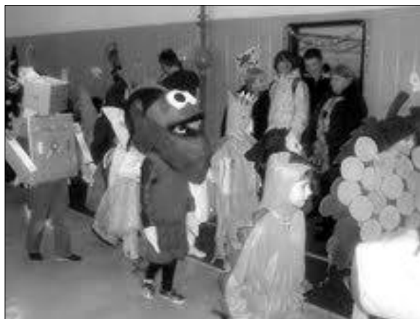
Škoda, že fotografia nemôže byť vo farbe.....