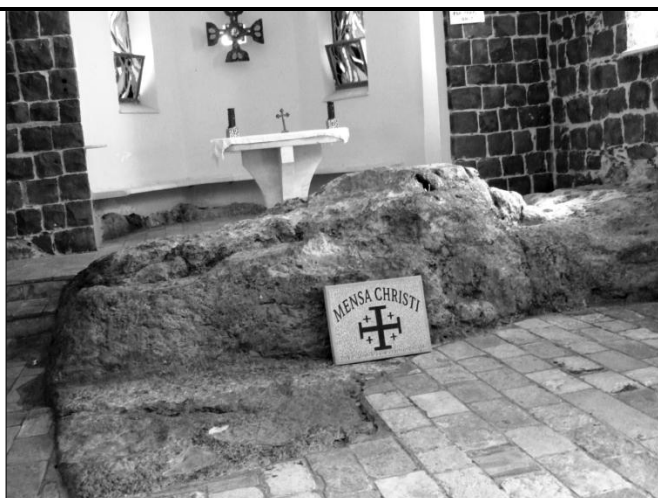
Mensa Christi, kameň v kostole Primátu sv. Petra

Kostol sa nachádza v malom, tichom prístave spolu s otesanými schodmi, o ktorých sa hovorí, že na nich Pán Ježiš stával, keď pozeral na vodu. Ďalšia naša cesta viedla na miesta, kde Ježiš stretol svojich prvých učeníkov Petra, Ondreja, Jakuba, Jána a Matúša – rybárov na Galilejskom mori. Tu sme mali príležitosť okúpať sa a ochutnať miestnu špecialitu - rybu, pečenú na otvorenom ohni, ktorú volajú „Ryba sv. Petra“. Po niekoľkohodinovej prestávke sme prešli k vykopávkam mesta Kafarnaum, ktoré bolo za Ježišových čias bohaté židovské mesto. Pán Ježiš tu vykonal mnoho zázrakov. Zo Svätého písma poznáme uzdravenie malomocného, uzdravenie stotníkovho sluhu i Petrovej svokry a ďalšie uzdravenia (Mt 8, 1-16).