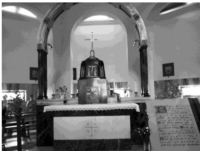
Interiér kostola Rozmnoženia chleba a rýb